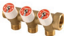
Collettore con valvole di regolazione a tre derivazioni